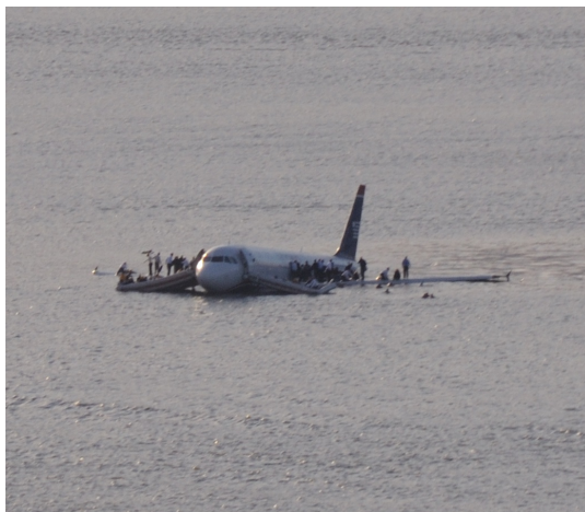
Foto des notgewasserten US-Airways-Fluges 1549 im Hudson River