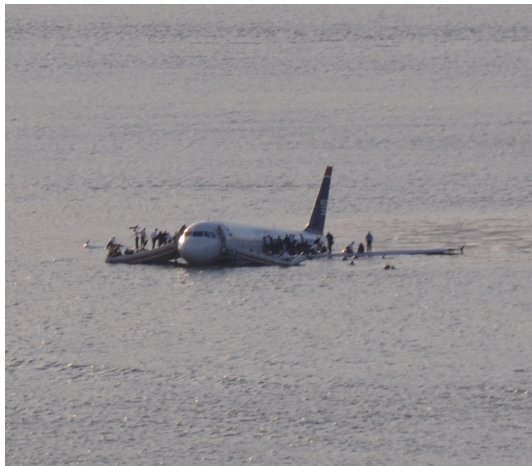
Foto des notgewasserten US-Airways-Fluges 1549 im Hudson River